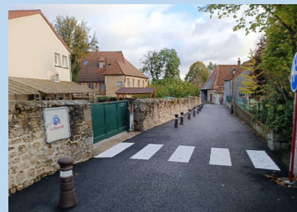
SECURISATION BOULEVARD DE LA VILLE