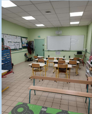
RÉFECTION SALLE DE CLASSE DU CP