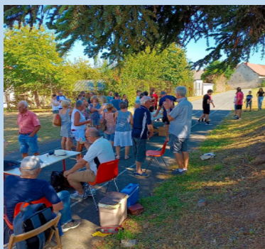
SEPTEMBRE : FORUM DES ASSOCIATIONS