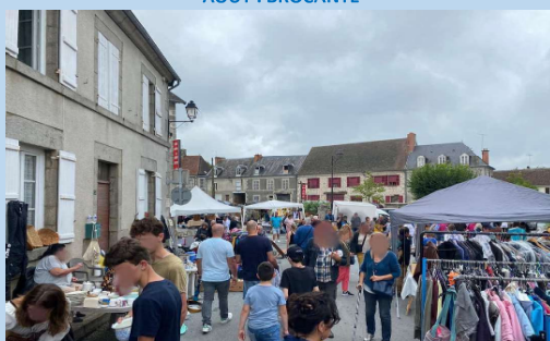
AOÛT : BROCANTE