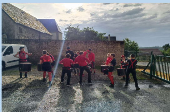
JUIN : FÊTE DE LA MUSIQUE